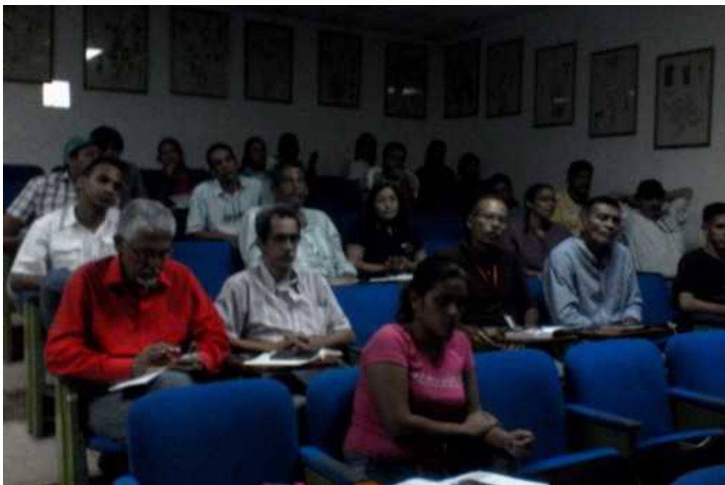
Región Centro Occidental (Portuguesa, Barinas, Lara y Yaracuy)