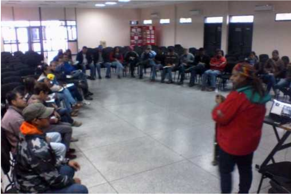
Región los andes (Táchira, Trujillo y Mérida)