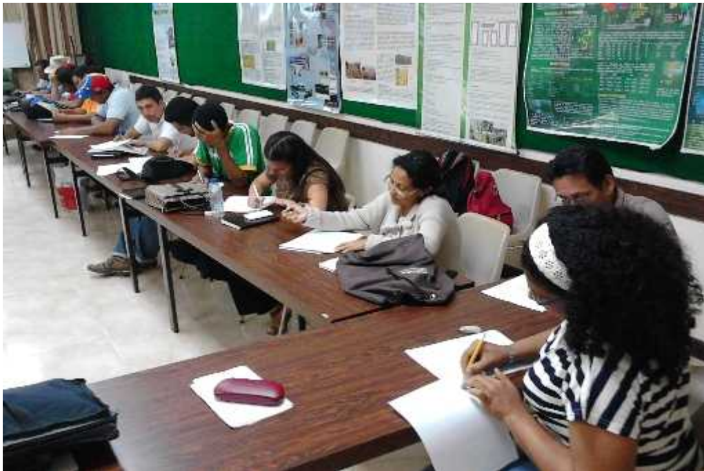
Región Central y llanos (Aragua, Guarico, Miranda y Apure)

profesionales de la ciencia del INIA que si estamos abocados al trabajo con compromiso y amor por la patria soberana.